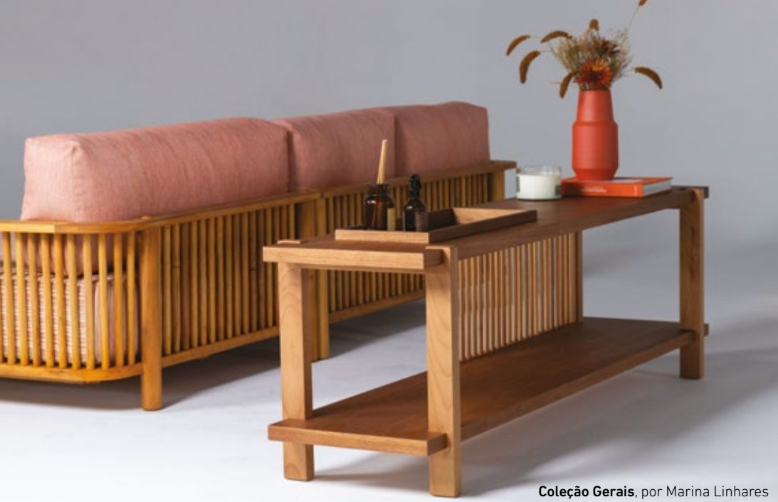
Coleção Gerais, por Marina Linhares